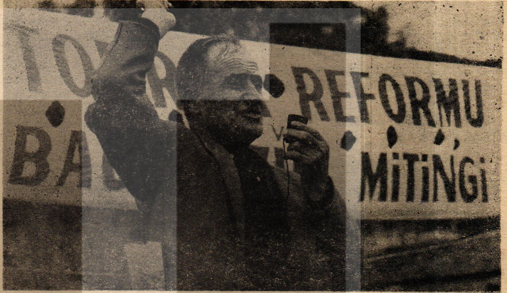
Söke'de yapılan Bağımsızlık ve Toprak Reformu mitinginde ağalığa ve Amerikaya karşı çıkan bir köylü

köylü elâleme boyun eğmekten, kula kul olmaktan kurtulur... Öyleyse bu toprak reformunu kim yapacak?